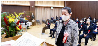
安全なまちづくり・とやま賞 特別優良表彰 射水市商工会女性部